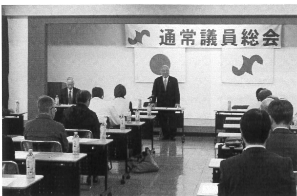
通常議員総会の様子